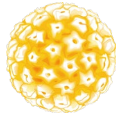
Struktur des Hüllproteins HPV

Sie unterscheiden sich in der Zulassung und Wirksamkeitsbreite (siehe gegenüberliegende Seite).